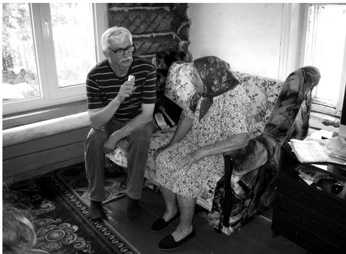
Фольклорно-этнографическая экспедиция в с. Русаново Орловского района Кировской области. 2013 г.