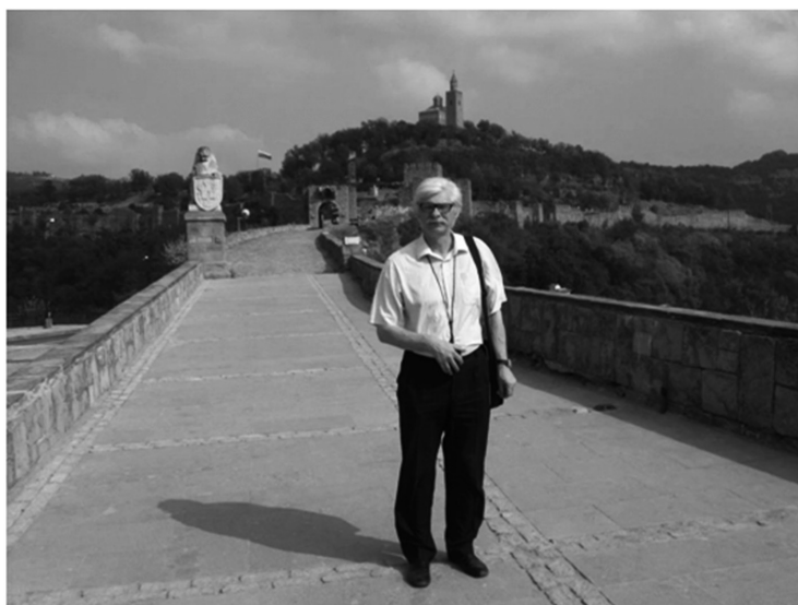
Республика Болгария, г. Велико Тырново. 2012 г.