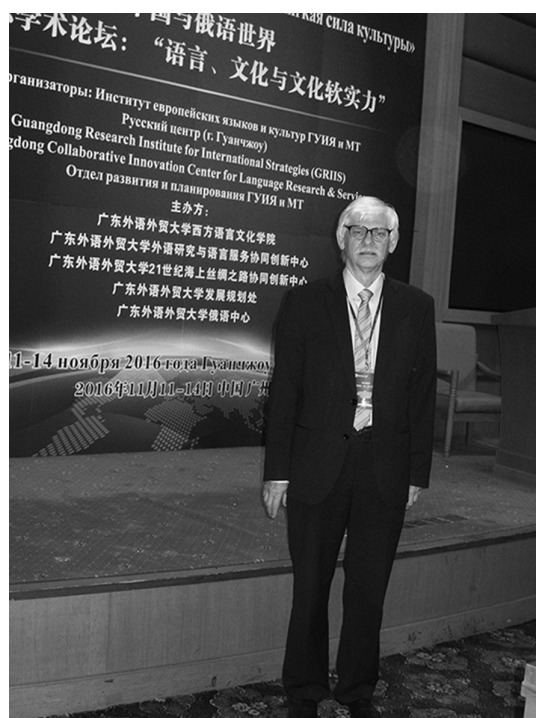
Международная конференция «Китай и Русский мир: язык, культура и «мягкая сила» культуры: международный форум» (Китай, Гуанчжоу, Гуандунский университет иностранных языков и международной торговли, 11–14 ноября 2016 г.).