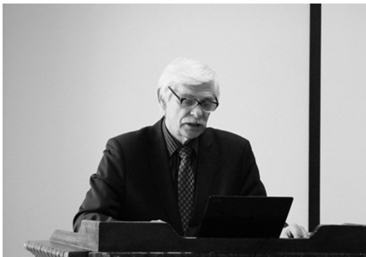
Международная конференция «Человек и событие в исторической памяти» (Сыктывкар, 28–30 сентября 2016 г.).