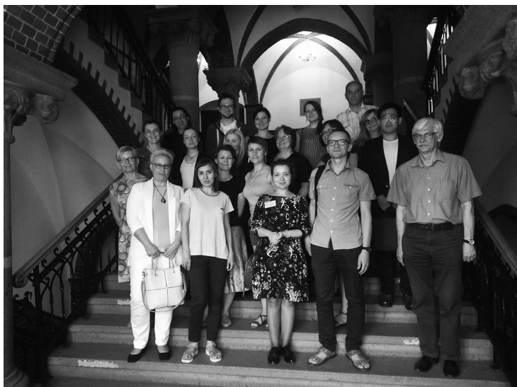
Международная научная конференция «Фольклор и фольклорно-литературные связи в современных исследованиях» (28–29 мая 2018 г., г. Торунь, Польша).