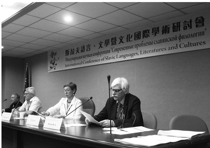
Международная конференция «Современные проблемы филологии: трансформация ценностей в славянских языках и культурах» (Тайвань, г. Тайбэй, факультет славистики государственного университета Чжэнчжи, 2017 г.).